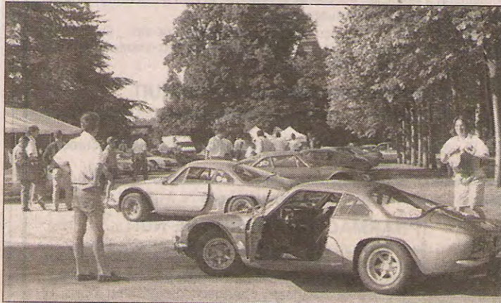
Quarante modèles étaient exposés

Les propriétaires d'Alpine qui souhaiteraient rejoindre le club peuvent téléphoner au 78.40.78.71.