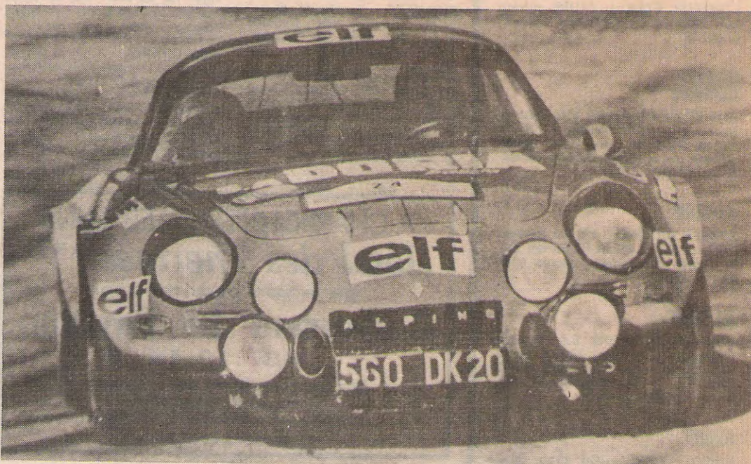
La flèche « Bleue » championne du monde des rallyes en 1973.

Renseignements : A.L.B.A. Tél. (7) 202.93.01.