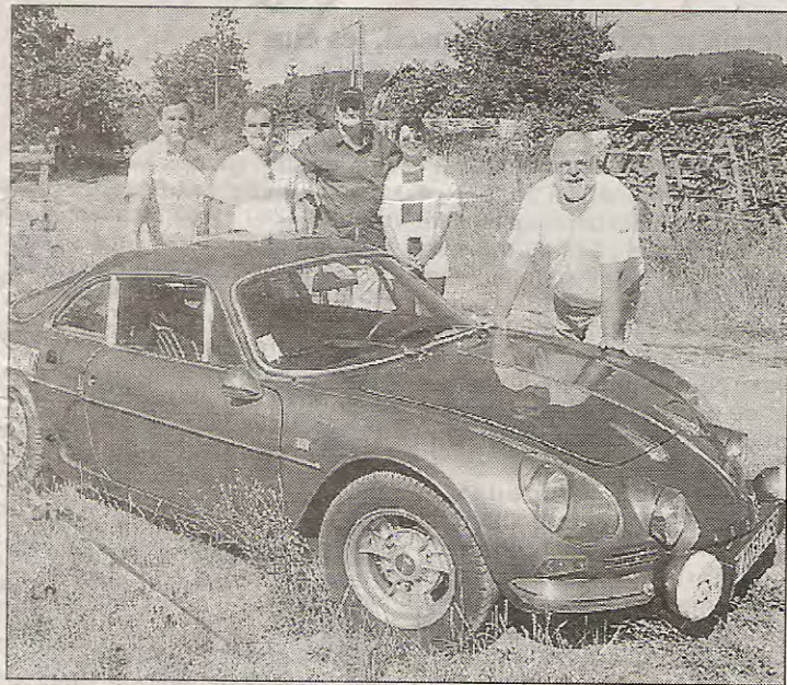
La berlinette Alpine entourée de ses amateurs.

de conservation remarquable, bien bichonnées par leurs propriétaires. L'Etainsel tenait ainsi à remercier ce club qui les soutient avant d'entamer pour 2004 une tournée avec un nouveau spectacle de music-hall baptisé : « c'est la fête », composé de chants, de danses, de claquettes, de mimes et de sketches. Ce nouveau spectacle aura probablement autant de succès que le précédent qui retraçait l'histoire du music-hall du début du siècle à nos jours.