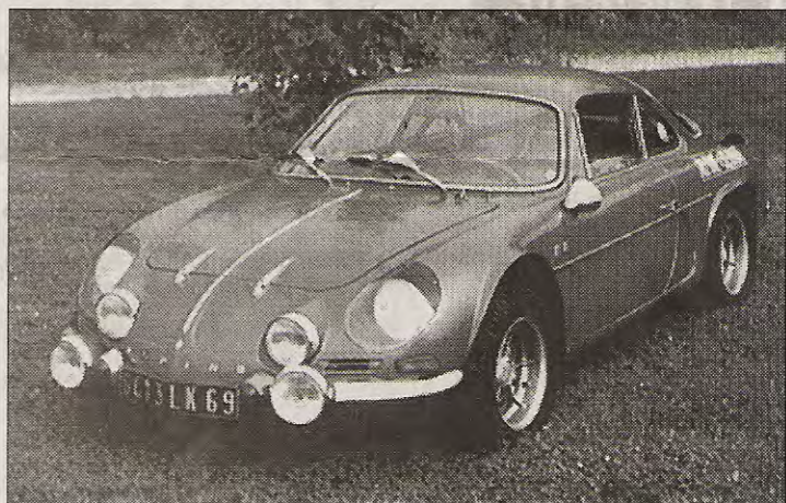
La Berlinette A-110-1 600 S, modèle 1972.

La carrière de l'A-110 se termina en 1977. Deux après, l'ALBA se créait afin de garder encore allumée la flamme de la Berlinette. Le club rassemble les possesseurs et les passionnés d'Alpine Renault. Il dispose de moyens techniques personnels : atelier de réparation et de rénovation, initiations mécaniques organisées par un professionnel, documentation technique et historique. L'ALBA participe régulièrement à des concentrations depuis 1980, date à laquelle le club organisa à Lyon, la première