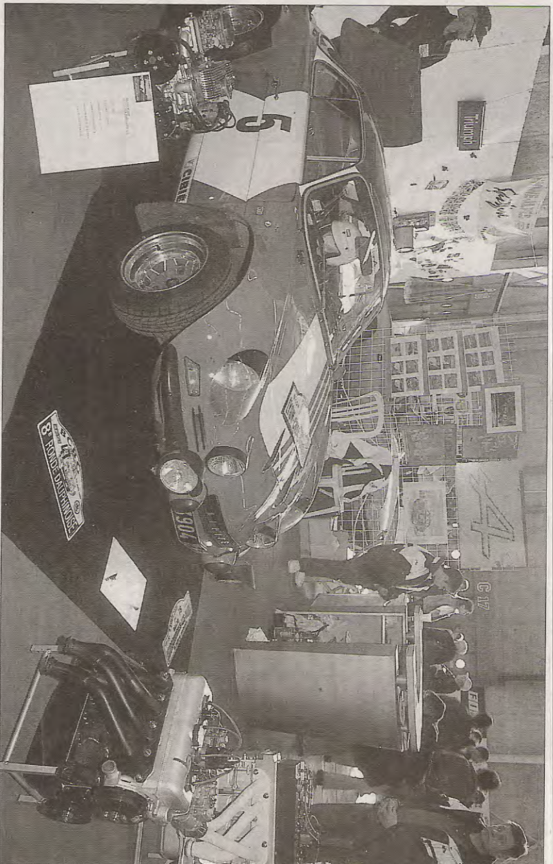
Le stand des Amateurs lyonnais de Berliette Alpine était le plus captivant avec ses moteurs autour d'une A 110 Groupe IV.

Après une première édition déficitaire, Solea organisait les 15 et 16 mars le deuxième Salon de Lyon autos et motos d'exception. Si les motards étaient ravis, les amateurs d'automobiles d'exception étaient plus réservés.